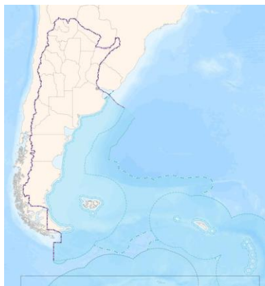
Figura 1: Área de estudio

Para lograr optimizar el tiempo de procesamiento se dividió a la totalidad del área en las 6 regiones de la Argentina: Centro, Patagonia, NOA, NEA, Cuyo y Atlántica.